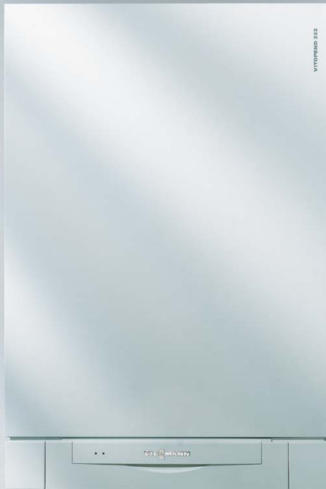
Vitopend 222-W Cazan mural pe combustibil gazos