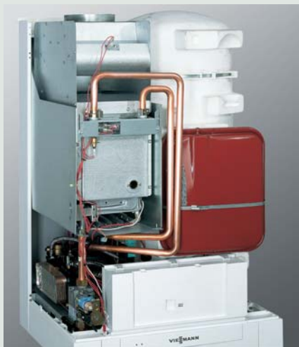
Vitopend 222-W Cazan mural cu boiler încorporat pentru prepararea apei calde menajere

Prin instalarea unui cazan mural Vitopend 222-W beneficiați de o economie de spațiu, deoarece nu se impun spații laterale pentru service. Hidroblocul, schimbătorul de căldură și celelalte componente sunt accesibile prin partea frontală, simplificând operațiunile de service.